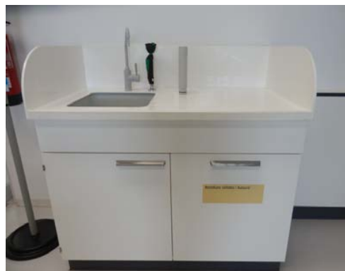
Vertedoiro + espazo para neveira (entrando á esquerda)