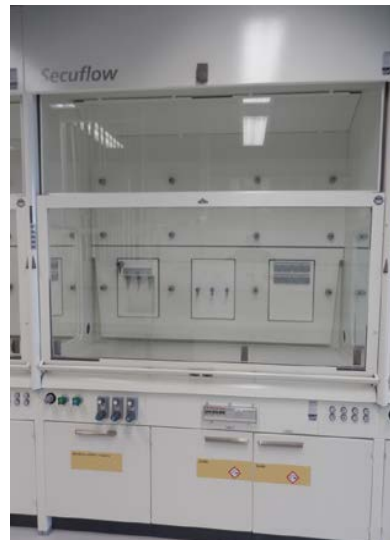
Vitrinas de gases 1ª e 2ª (parte esquerda do laboratorio)