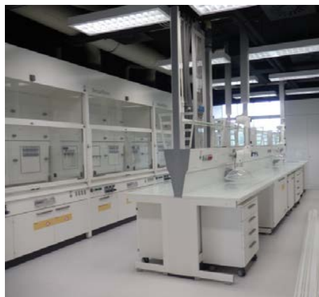
Mesa central + Mobles baixos + Vertedoiro + Brazos extractores