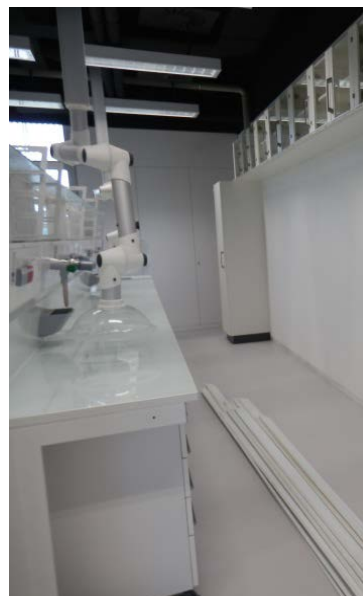
Armario para reactivos e substancias químicas + Armarios colgados para almacenaje (parte dereita do laboratorio)