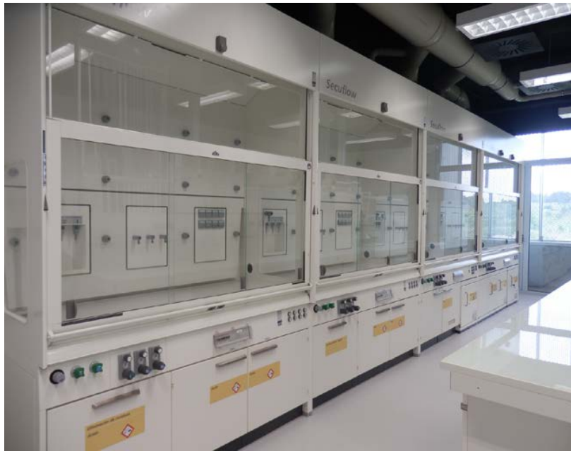
Conxunto de 4 vitrinas de gases (parte esquerda do laboratorio)