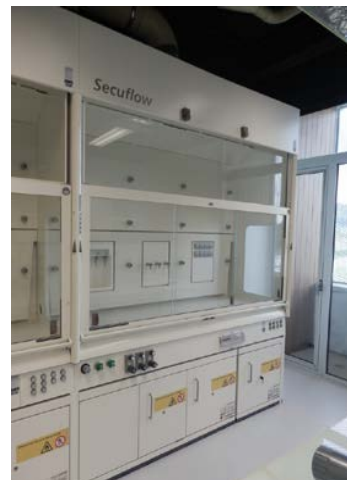
Vitrinas de gases 3ª e 4ª (parte esquerda do laboratorio)